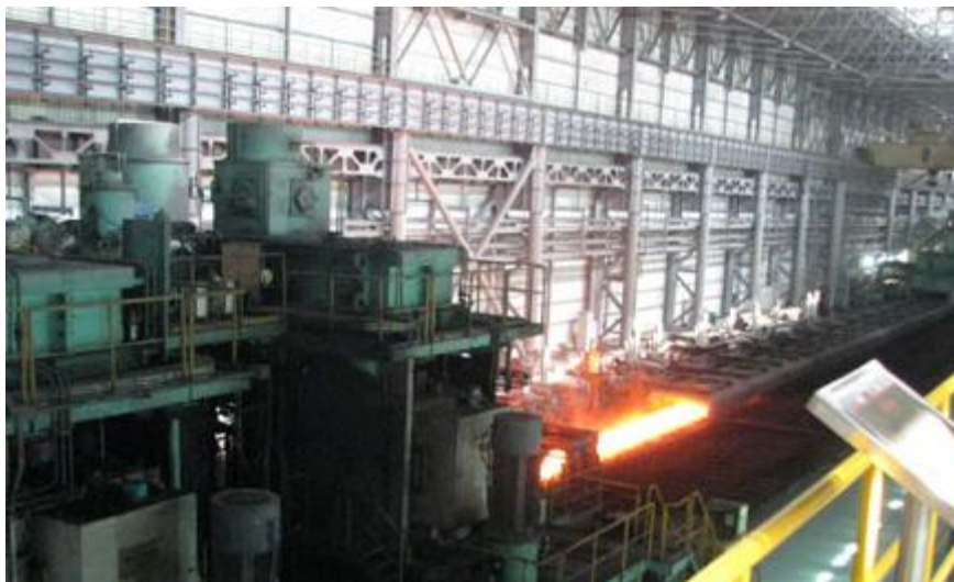
钢铁加工改制项目

本项目占地面积为 46 亩，建筑面积 15700 平方米。年加工改制钢铁产品 15 万吨。