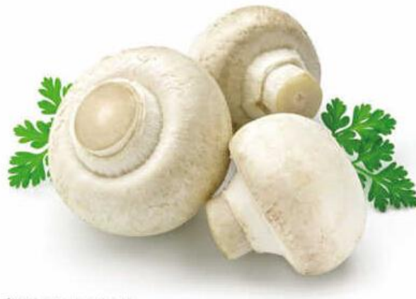
甘肃某食用菌工厂化项目

在产品推出初期和重大的节假日，为宣传新产品，对新产品进行特价销售。宣传主题围绕“健康生活”、“绿色营养食品，科学规模化栽培”进行。对代理商或经销商的返利，实行阶梯政策，最大限度的刺激销售。在各级食用菌经销商门店制作精美的广告牌，扩大公司产品的影响力。