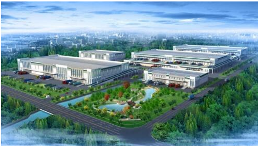
山东某物流园项目

本项目用地近 800 亩，主要分成两个区域：林浆纸一体化物流基地和物流信息服务平台，用地 400 亩；浆纸博览交易中心和临港公共物流服务中心，各占地 200 亩，主要建设浆纸博览交易中心、超大件公共物流服务中心、废弃物监控中心等项目。