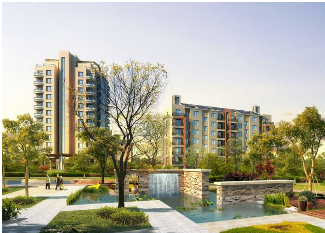
吉林省某高档住宅小区项目

项目总投资 85000 万元，建设面积 336500 平方米，主要用能设备有空调通风设备、采暖设备、照明设备等等。