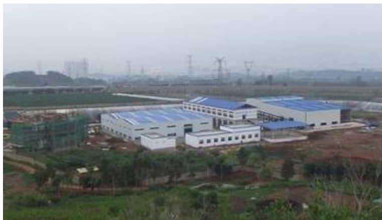
河北某垃圾资源化处理项目

项目处理厂占地面积 150 亩，约 100000 m 2 。工艺用房建筑积 23000 m 2 ；停车场 4000 m 2 ；辅助用房 1680 m 2 ；堆场 3000 m 2 ；办公用房 1000 m 2 ；生活用房 3000 m 2 ，停车场 4000 m 2 。其余场地为道路、绿化场地等。