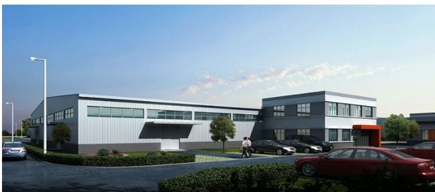
广东某年产 50 万套汽车电气系统

项目占地 38886 平方米，项目厂房、办公楼及其他辅助工程等租赁，租赁面积为 23170 平方米。