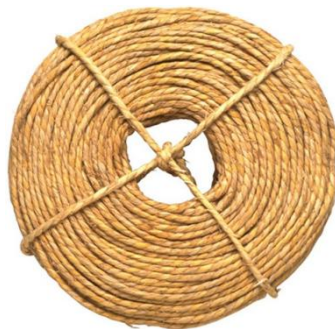
河南某秸秆再利用项目