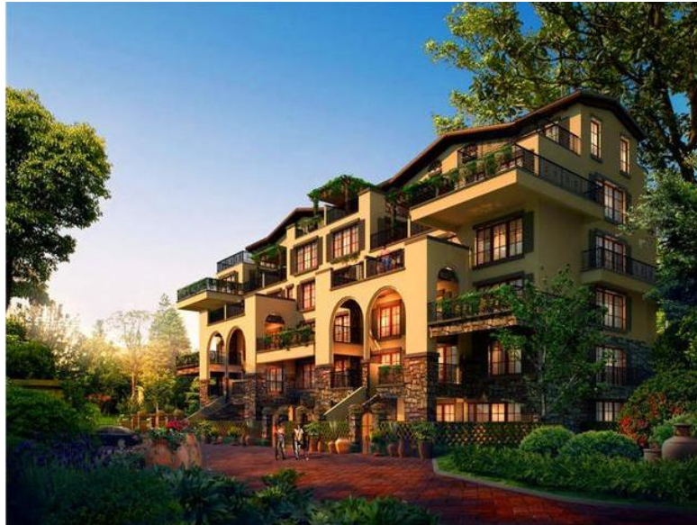
海南某养老景观旅游住宅项目