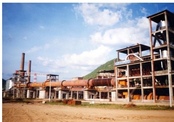
河北某回转窑建设项目

主要建设内容：1、拆除现有小回转窑和隧道窑。2、建设主体长度60米的回转窑。3、增加余热回收装置和脱硫塔设备。