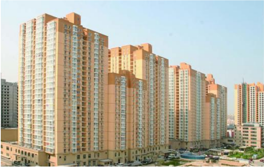
山东省住宅建设项目