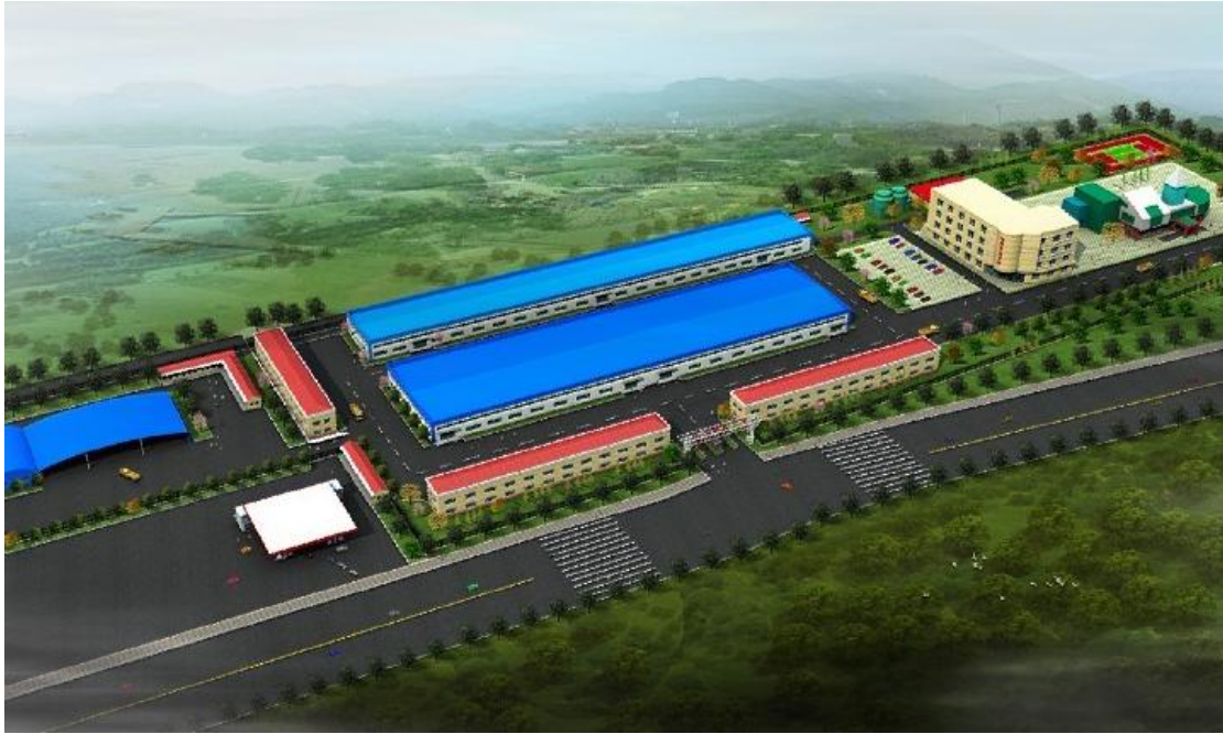
河南省面粉及方便面加工项目