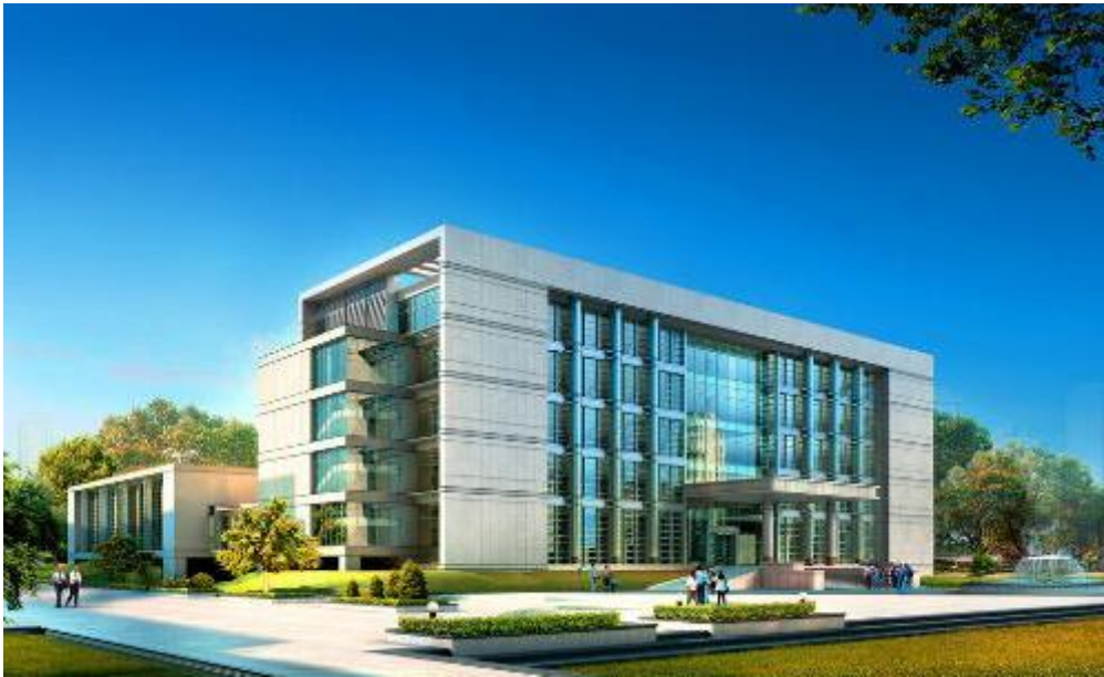
安徽某年产 6000 台 ATM 机项目