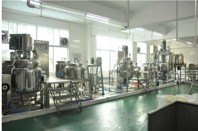
上海某生物科技面膜生产项目