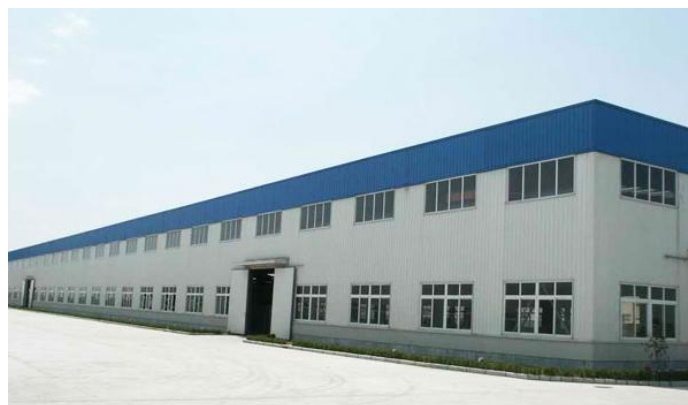
山东某岩棉生产与销售项目