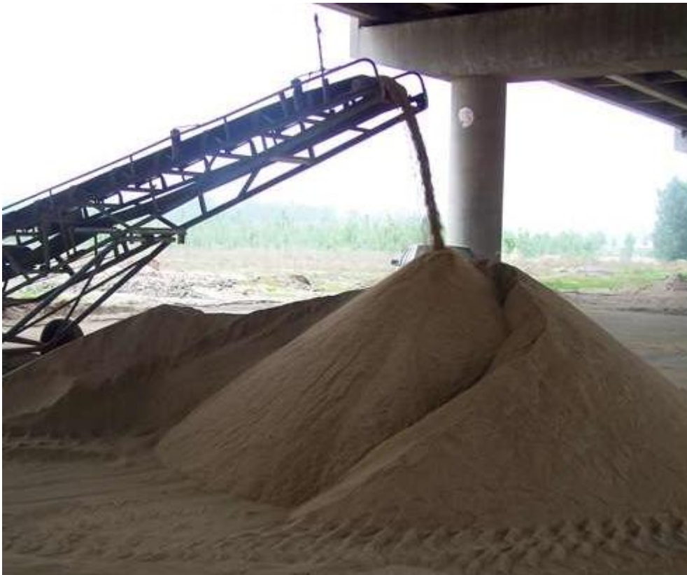
河北某年产 100 万吨机械砂石项目

项目总用地 60 亩（40000 m 2 ），总建筑面积 24800 m 2 ，主要建设生产车间、原料仓库、成品仓库、办公楼、宿舍食堂、其他辅助用房及配套道路、绿化等。