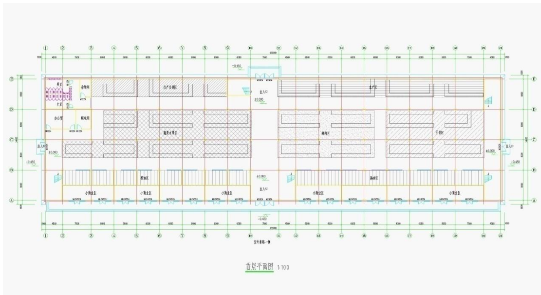
图表 3：项目首层平面布置图