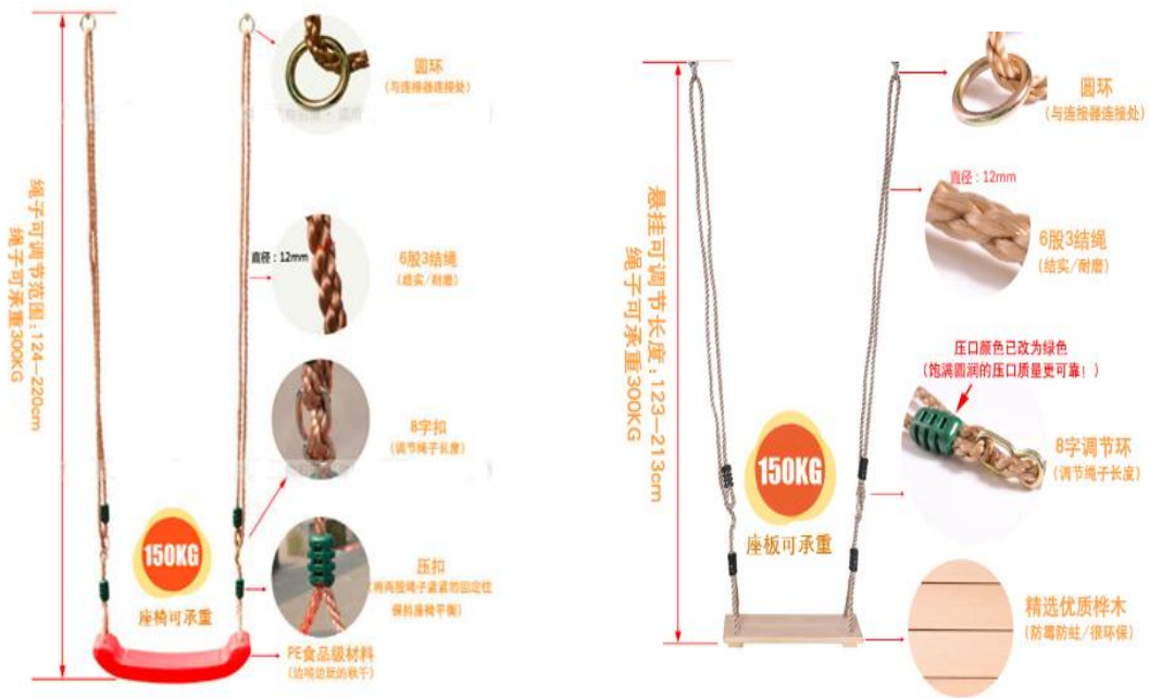
图表 5：儿童秋千产品示意图

秋千以儿童游乐和安全为主题，根据不同年龄的儿童设计不同风格的秋千，如田园风的木质秋千，色彩鲜艳的彩色秋千及多功能型秋千。