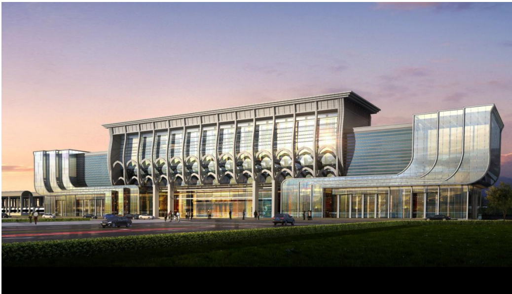
图表 1：旅游服务站一期透视图

配套文化休闲广场浮雕墙及艺术景观工程处于高铁站和小型会展中心之间的区域，具有旅游集散和城市广场公园的复合功能，是展示城市文化和地方特色的重要窗口之一。浮雕墙及艺术景观工程建设浮雕面积 4880 m 2 ，其中平浮雕 1704.36 m 2 ，浅浮雕 377.43 m 2 ，圆雕 87.21 m 2 ，干挂龙骨 1617 m 2 ，二维半圆雕 106.1 m 2 ，20mm 底板背景花岗石 689.3 m 2 ，30mm 水纹浮雕面积 931.1 m 2 。