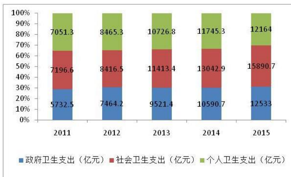
图表 6：2011-2015 年卫生费用政府、社会、个人支出情况