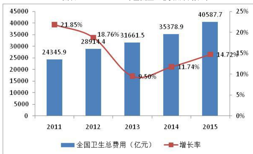
图表 2：2011-2015 年全国卫生总费用及增长率

与此同时，我国人均卫生总费用水平近年来也始终保持两位数的增速，从2010年的1,490元增长至2015年的2,952元，年均复合增长率达到14.7%。