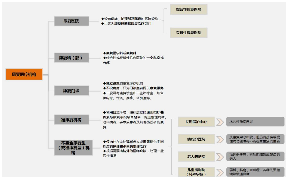
图表 21：康复医疗机构分类

目前全国各地都有各种形式的康复医疗机构，开展了形式多样的康复或康复医疗服务。归类下来，康复治疗机构可分为：康复医院（康复专科医院）、康复科（综合医院中的康复科）、康复门诊（康复诊所）、准康复医疗机构（如长期留治机构、病残护理院等）和不完全康复型机构等。