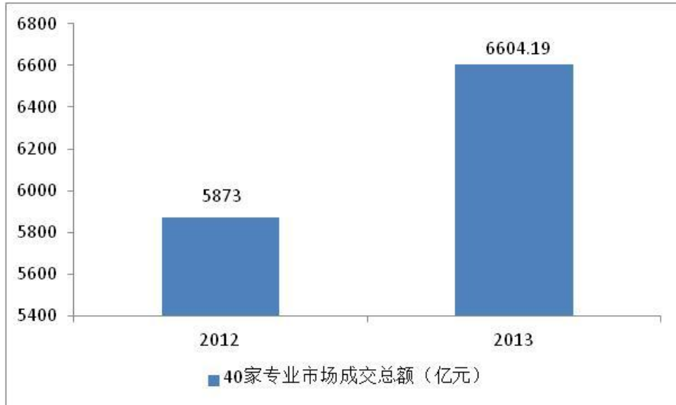
图表 4：2012 与 2013 年 1~11 月重点监测的 40 家专业市场成交总额对比情况

场的单位成交额下降。2013 年 1~11 月 25 家服装专业市场成交总额 3140.52 亿元，同比增长 10.08%，但增长幅度比上年同期的 21.98% 回落 11.9 个百分点。其中，16 家市场单位成交额增长，9 家市场单位成交额下降。