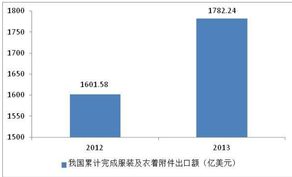
图表 5：2012 与 2013 年我国累计完成服装及衣着附件出口额对比情况

我国服装出口对发达市场的依赖程度在降低，对有自贸协定的国家和地区的出口增长明显。近年来我国加快推进自贸区建设，大力开拓新兴市场。2013 年东盟、俄罗斯、巴西、墨西哥组成的新兴市场，我国实现共计 264.73 亿美元的 45.36 亿件服装的出口，金额同比增长 34.76%，数量实现 34.33% 的增长。