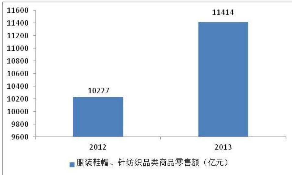
图表 3：2012 与 2013 年服装鞋帽、针纺织品类商品零售额对比情况

2013 年全国服装类商品零售价格同比上涨 2.2%，较上年同期下降 0.7 个百分点。衣着类居民消费价格同比上涨 2.3%，较上年同期下降 0.8 个百分点。可见 2013 年服装价格总体微涨，但走低趋势显现。