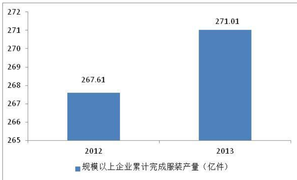
图表 1：2012 与 2013 年规模以上企业累计完成服装产量对比示意图

规模以下企业的生产状况明显逊于规模以上企业。根据中国服装协会对孙村、茶山、沙溪、黄石、金坛、平湖等 18 个服装产业集群近 200 家企业的跟踪调研，2013 年 1~9 月的数据显示：11.69% 的规模以下企业关停，总产量同比降少 6.58%。